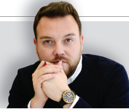
MUSTAFA KULELİ TÜRKİYE GAZETECİLER SENDİKASI GENEL SEKRETERİ