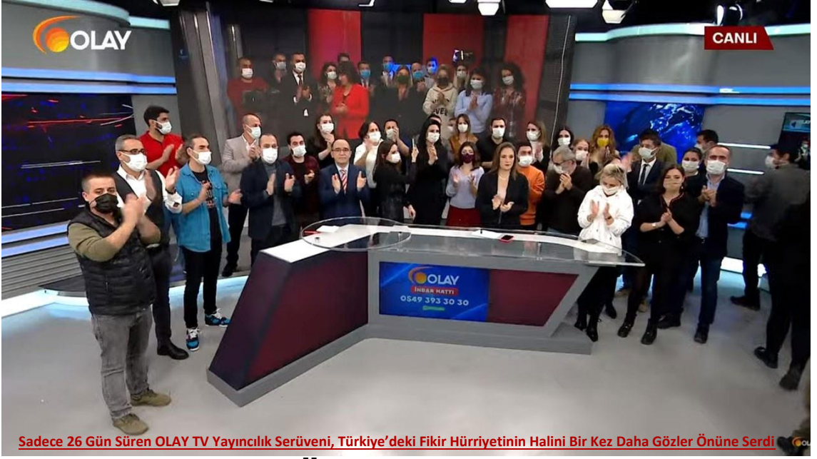
Sadece 26 Gün Süren OLAY TV Yayıncılık Serüveni, Türkiye'deki Fikir Hürriyetinin Halini Bir Kez Daha Gözler Önüne Serdi